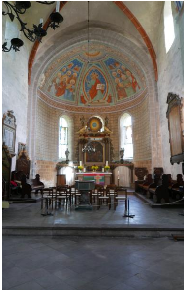
im Kloster Zinna